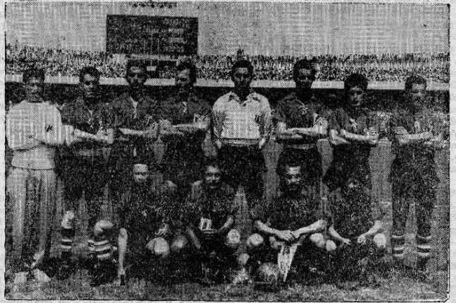
MUNDO FEMENINO se complace en presentar un atento saludo a la Escudra Nacional de Fútbol por el resonante triunfo que ha obtenido frente a Chile y Argentina en los Segundos Juegos Panamericanos