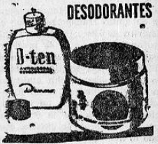
REGULA LA TRANSPIRACION DE LAS AXILAS Y LAS DESODORIZA POR VARIOS DIAS

que requieren una alimentación adecuada para su desarrollo. En este aspecto debe tomar medidas el Consejo Nacional de la Producción, a fin de ayudar a la uniformidad de los precios de los artículos de consumo inmediato y garantizar al asalariado su adquisición regular de acuerdo con su poder adquisitivo. No podemos seguir soportando el aumento constante de los artículos, si los salarios permanecen estables por más de un año. Hay que hacer números y darse cuenta en qué proporción suben los precios de artículos de primera necesidad y consumo inmediato y su relación con los salarios acordados. El Consejo de Salarios debe estudiar el problema, no desde el punto de vista del momento en que dictan sus resoluciones, sino en el promedio en que durante el año suben los precios de los artículos que forzadamente deben consumirse. Para